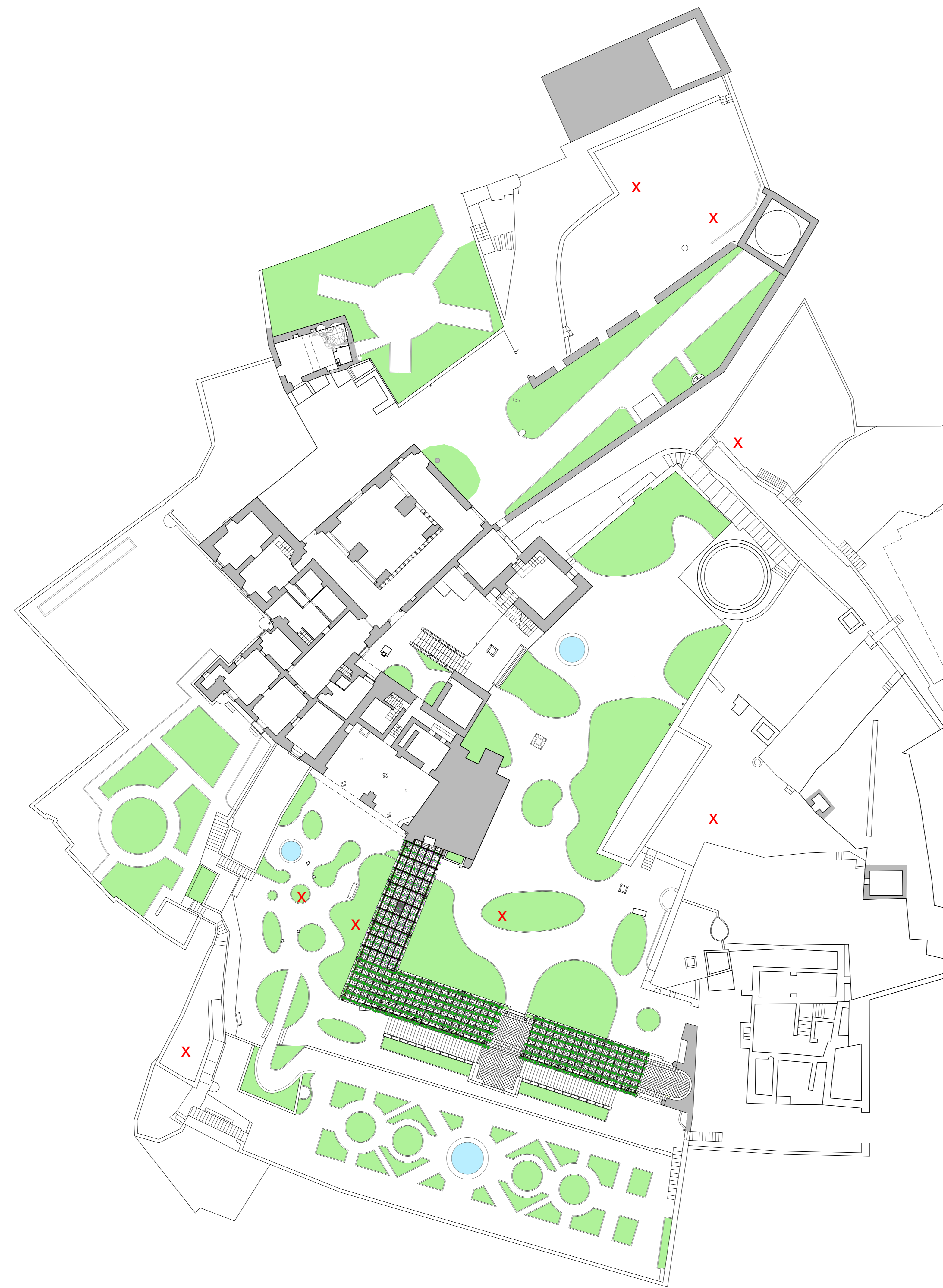
PIANTA GENERALE DI VILLA RUFOLLO- Stato dei luoghi SCALA 1:1000