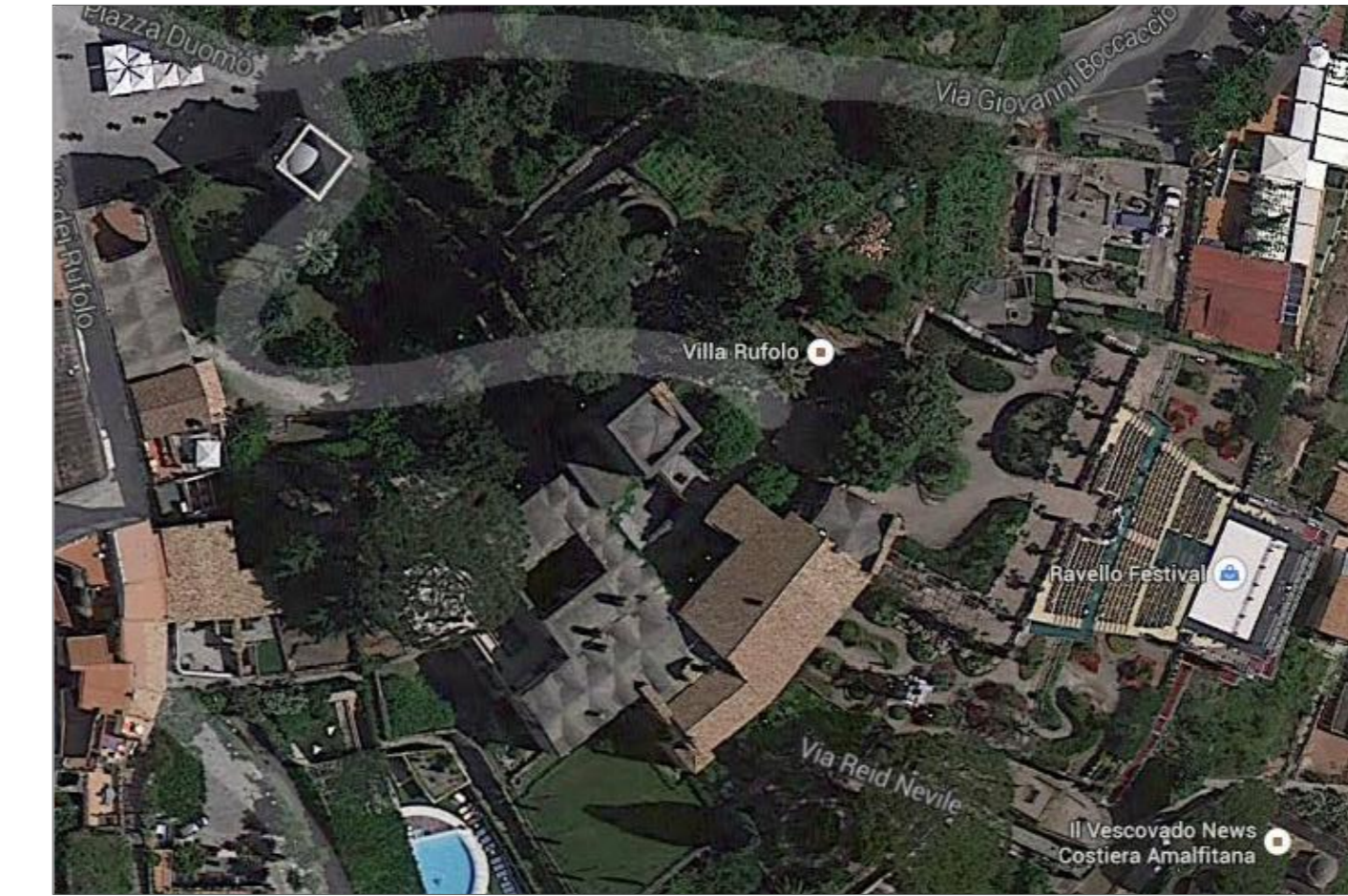
Vista aerea della Villa Rufolo- stato dei luoghi